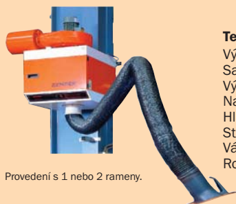
Provedení s 1 nebo 2 rameny.