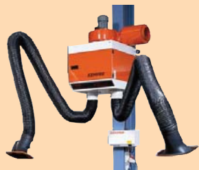
Provedení s 1 nebo 2 rameny.